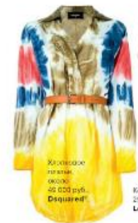
Хлопковое платье около 46 000 руб. Dequard