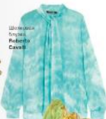
Шелковая блузка Roberto Cavalli