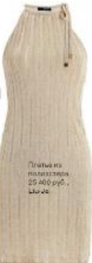
Платье из полиэстера 26 400 руб. Clio Jo