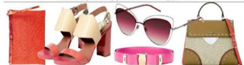
Сумка, Space Style Concept; босоножки, Max & Co.; солнцезащитные очки, Marc Jacobs; пояс, Salvatore Ferragamo, farfetch.com; сумка, Coccielle