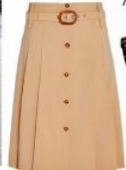
Юбка из шерсти и золота Michael Kors Collection