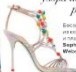
Босоножки из кожи и пластика Sophia Webster