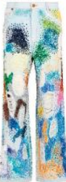
Джинсы расшитые бисмарком, Ashish