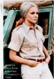
Летняя рубашка Diana Fenek вместе с сандалями Santoni, 1980