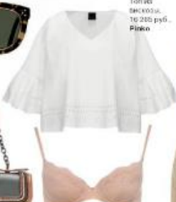
Топик вельвет. 16 200 руб. Pinko