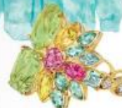
Золотое кольцо Granville с фиолетовыми тур- малинами, бирюзовыми, сапфирами, шпинелью и рубином, Dior Joaillerie