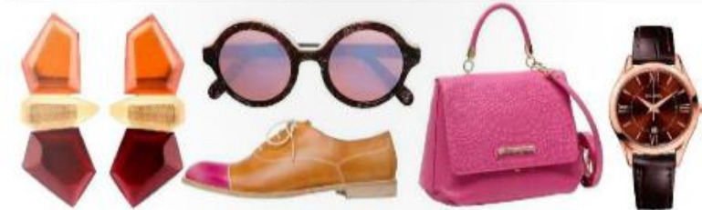
Серьги, Monica, farfetch.com; солнцезащитные очки, Cartier & Coos, farfetch.com; туфли, Fratelli Rosetti; сумка, Brunelini; часы Classio H Lady, steel, Balmain