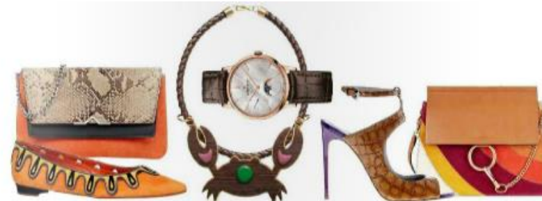
Сумка, Hugo Boss; туфли, Manolo Blahnik; часы Elite Lady Moonphase, розовое золото, перламутр, Zenith; кольцо, Tommy Hilftee; босоножки, Tullini; сумка, Chloe