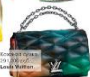
Кожаная сумка 291 300 руб. Louis Vuitton