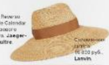
Соломенная шляпа 16 800 руб. Larvin