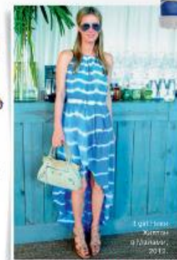
Летнее платье Хитман в Дублине, 2013