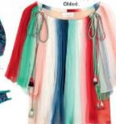
Шелковое бюстье 213 000 руб. Chloé