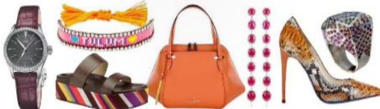
Часы Artelier Date Diamonds, сталь, бриллианты, Oris; браслет, Swarovski; босоножки, Vicioli; сумка, Cromia; серьги Bubbles, белое золото, бриллианты, рубины, Yana; туфли, Loriblu; кольцо Diane von Furstenberg, белое золото, гранаты, сапфиры, изумруды, камни, перидот, H Stern