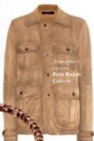
Замшевая куртка Rolo Ralph Lauren